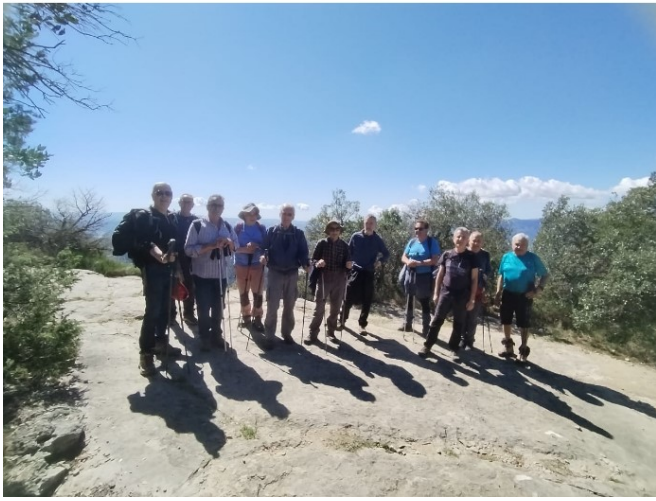
Sant Roc de la Barroca