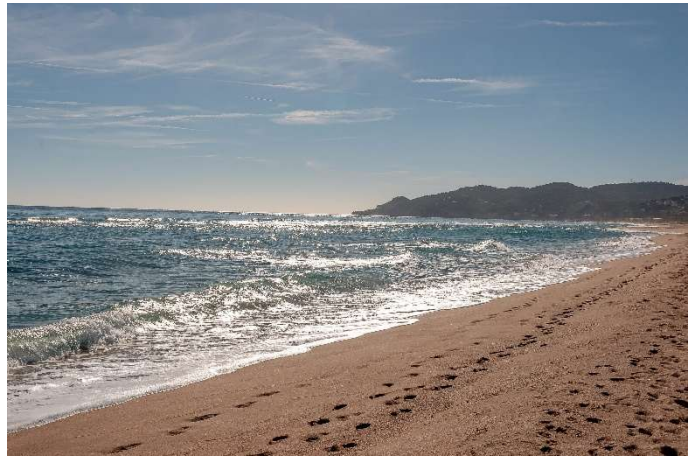
Fotografies del dinar al restaurant Golf Beach de la platja de Pals: