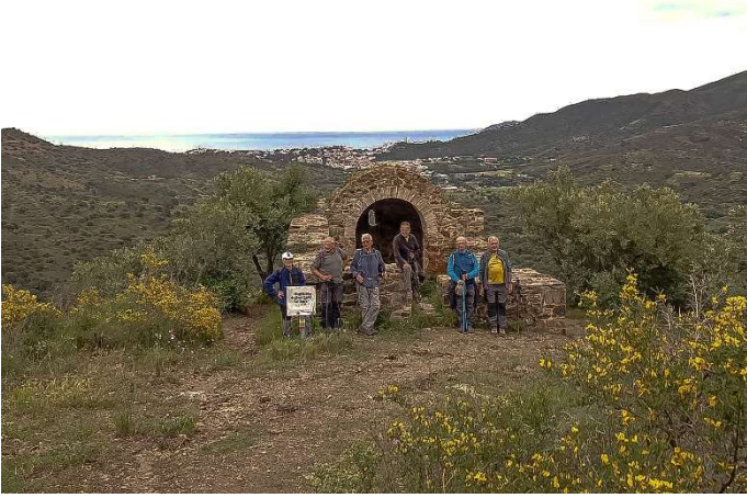
Fotografies del dinar al refugi de Sant Silvestre de la Valleta: